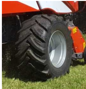
425/55 R 17“ mit AS