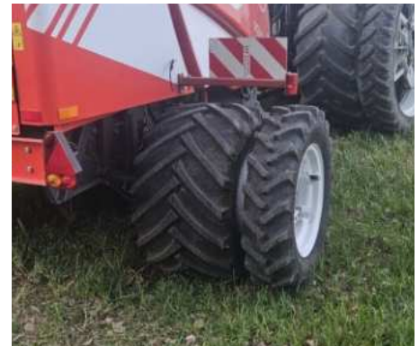
Auf Wunsch Doppelräder