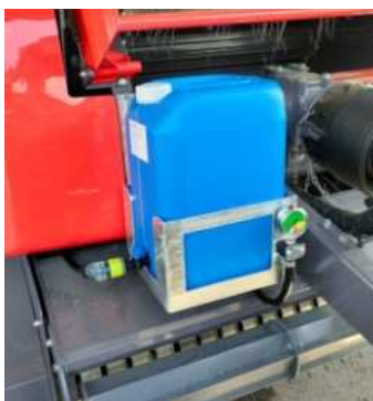
Sprayeranlagen in verschiedenen Ausführungen