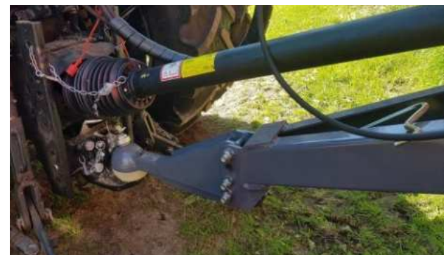
Anhängerkupplung Kugel - K80