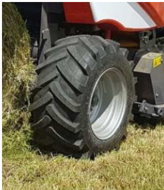
15.0/55-17“ mit AS

Die lauf ruhigen Fahreigenschaften der Mondiale 110 werden mit Bereifungen von 11,5/80-15,3“ bis 19.0/45-17““ Ausgestattet. Optional stehen verschiedene Profile und Doppelräder zum Angebot.